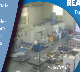
> Atelier B