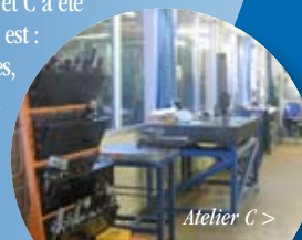
Atelier C >